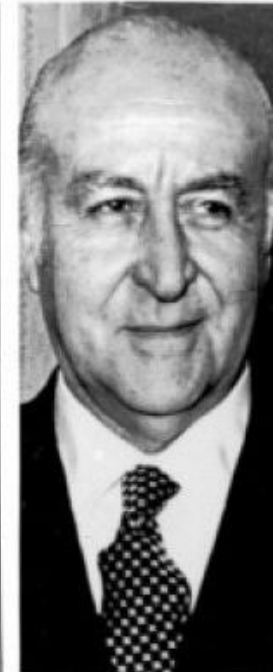
José María de Areilza

En la página 3, amplio informe de nuestro corres- pondente en Bruselas sobre las relaciones de España con la Comunidad Económica Eu- ropea.