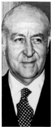
José María de Areilza.